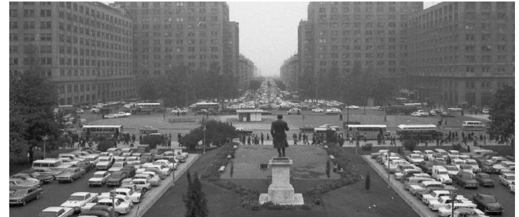
Vista a la Alameda y la Plaza de la Constitución desde el Palacio de La Moneda (ca. 1950).